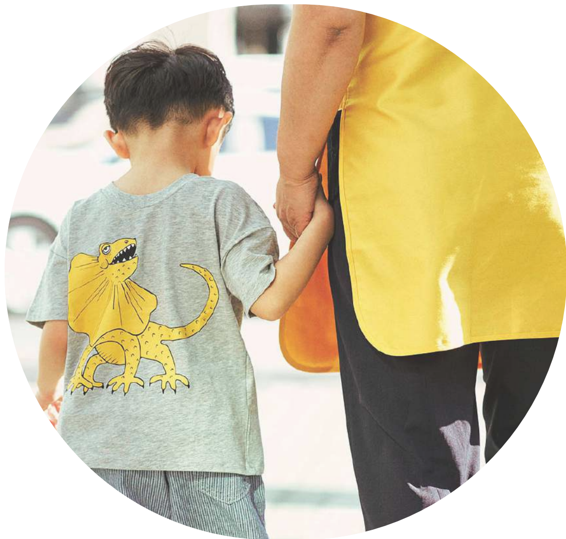
원하는 시간대에 안정적인 정기 등하원

우리동네 돌봄히어로는 부모님이 원하시는 요일과 시간대에, 마음 편히 일하실 수 있도록 정기 등하원 돌봄서비스를 제공합니다.