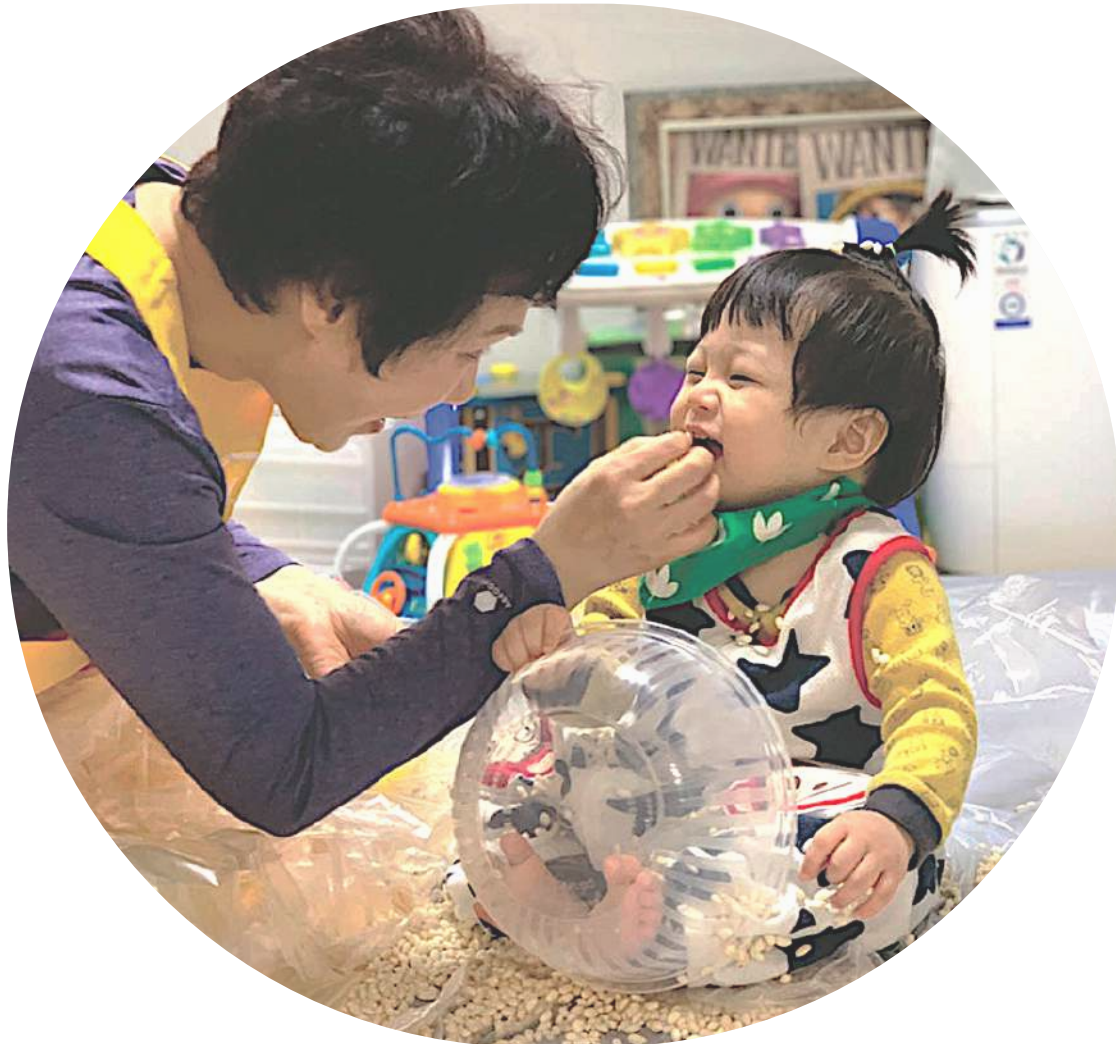
사랑과 정성으로 아이를 기다려주는 선생님

우리동네 돌봄히어로는 부모님이 원하시는 요일과 시간대에, 마음 편히 일하실 수 있도록 정기 등하원 돌봄서비스를 제공합니다.