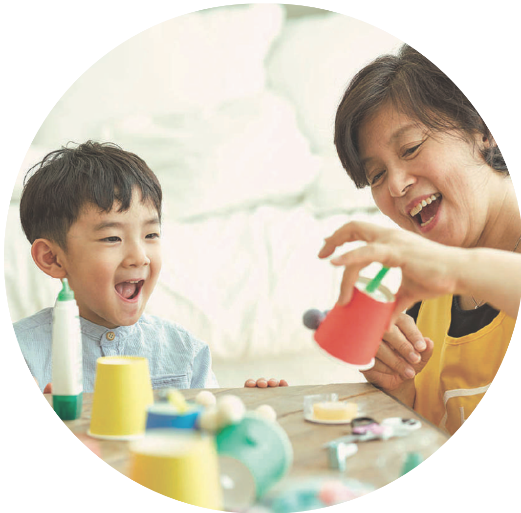
아이 성장의 원동력 놀이 기반 돌봄

히어로 선생님들은 자녀를 키워본 양육경험, 삶 의 연륜에서 나오는 여유와 인내심으로 아이를 기다려주고, 지지해 줍니다.